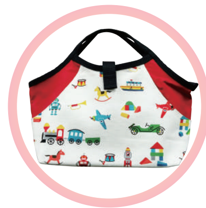
甜心手作包