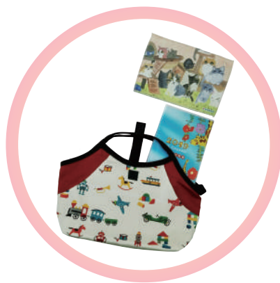
愛心匯集甜心組 (行事曆、甜心包、小方巾)